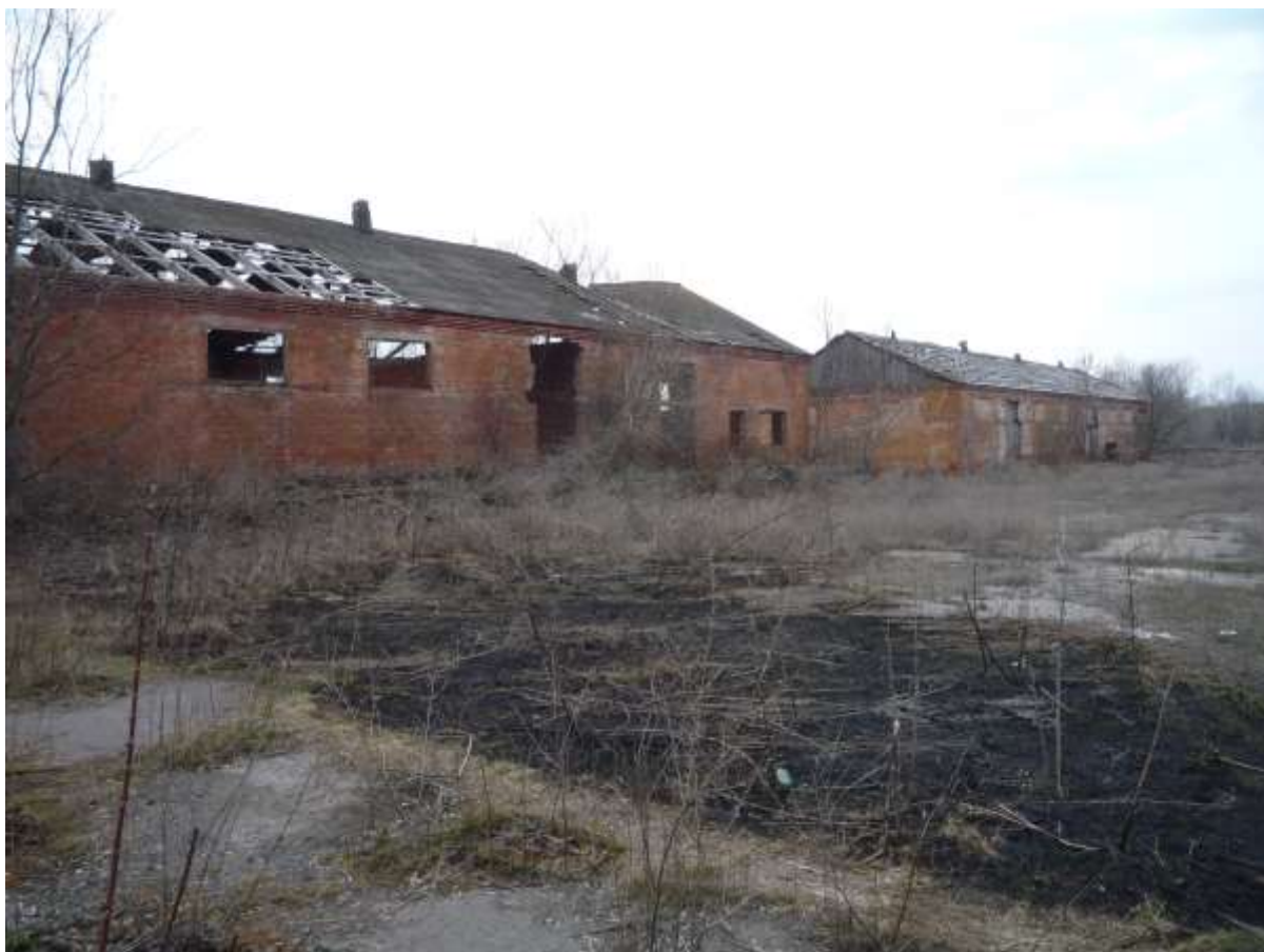
Фотографічні зображення майна, що продається. Лот № 1599 АТ/17.